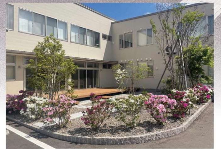
癒し空間のテラス