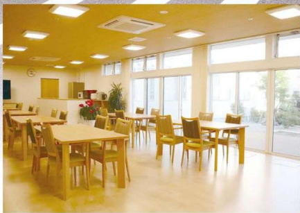
開放感あふれるラウンジ