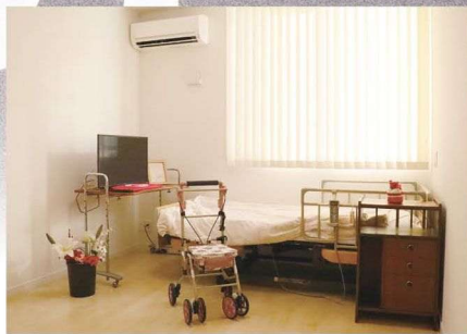
日当たりのよい居住